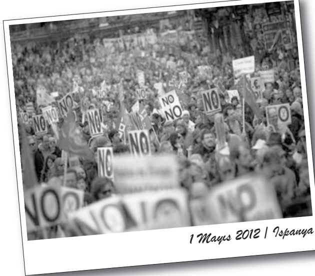
1 Mayıs 2012 | İspanya

Portekiz'de de özellikle Lizbon'da binlerce kişi sokaklara çıkarak 1 Mayıs kutlamalarına katıldı.