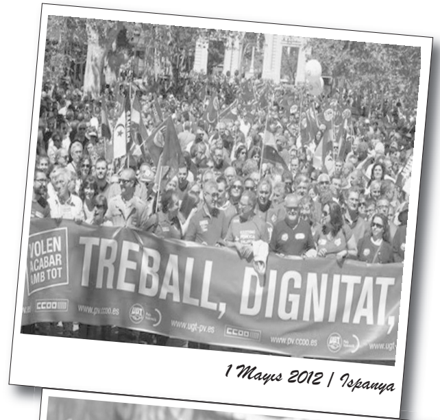
1 Mayıs 2012 | İspanya

Tayvan 'da ise 1 Mayıs'ta binlerce kişi hükümet karşıtı sloganlar atarak gösteri gerçekleştirdi. Başkent Taipei'nin merkezine yürüyen işçiler, yüksek maaş ve daha iyi çalışma koşulları talep etti. İşçi Bayramı'na katılan öğrenciler de, hükümetin harçlara yaptığı zamları geri alması talebini haykırdılar.