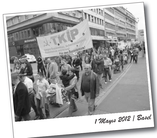
1 Mayıs 2012 | Basel

Yaklaşık 2000 kişinin katıldığı yürüyüşe Devrimci 1 Mayıs Platformu coşkusunu taşıdı. TKİP taraftarları 1 Mayıs'ta 50 kişilik kortejiyle yerlerini aldılar.