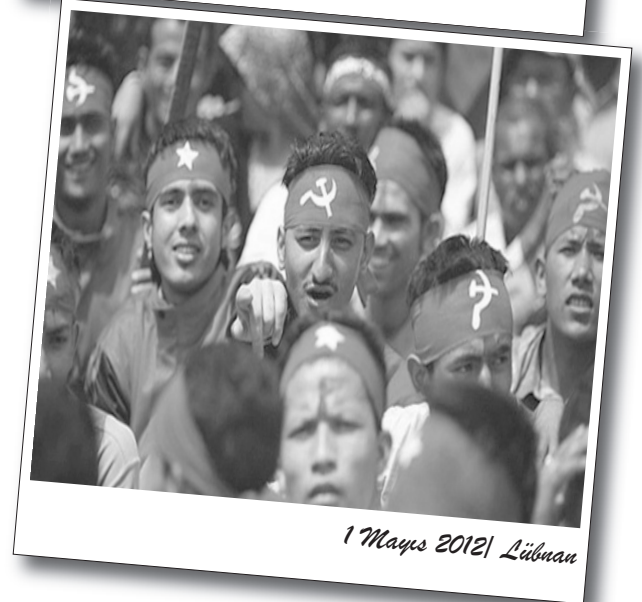
1 Mayıs 2012 | Lübnan

Malezya 'da yüzlerce kişilik bir grup Başbakan Necib Razak'ın 1 Mayıs'tan birgün önce açıkladığı asgari ücret zamlarını protesto etti. Asgari ücretin 521 TL civarında olduğu Malezya'da ilk kez maaşlara zam yapıldı.