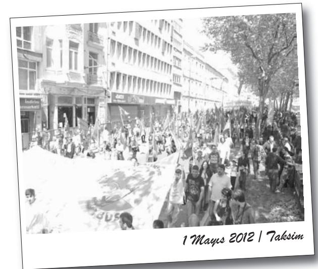
1 Mayıs 2012 | Taksim