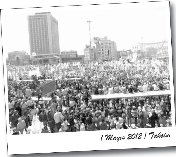
1 Mayıs 2012 | Taksim