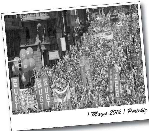
1 Mayıs 2012 | Portekiz

grev gittiği ülkede demiryolu hatları çalışanları 24 saatlik grev yaptı. Denizcilik sektörü çalışanları da 24 saatlik grev giderek kendilerine ait sosyal sağlık kurumunun, yeni oluşturulan Ulusal Sağlık Hizmetleri Kurumu (EOPYY) ile birleştirilmesine ve toplu iş sözleşmelerinin iptal edilmesine karşı çıktı. Dört büyük deniz ve liman çalışanları sendikası PEMEN, PENEN, PEEMAGEN ve OStefenson'un 24 saatlik grevi nedeniyle gün boyunca gemilerin büyük bölümü limanlarda bağlı kaldı, ana karayla adalar arasındaki gemi bağlantısı da kesildi.