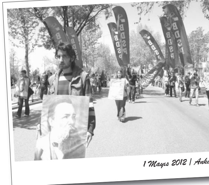
1 Mayıs 2012 | Ankara