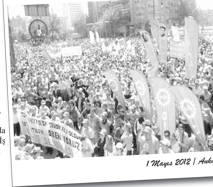
1 Mayıs 2012 | Ankara

* Ekim Gençliği'nin "Geleceğine sahip çık" bildirimleri dağıtılırken, gençlik 6 Mayıs'ta İstanbul'a çağrıldı.