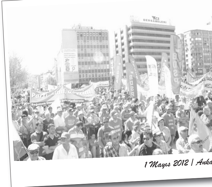
1 Mayıs 2012 | Ankara