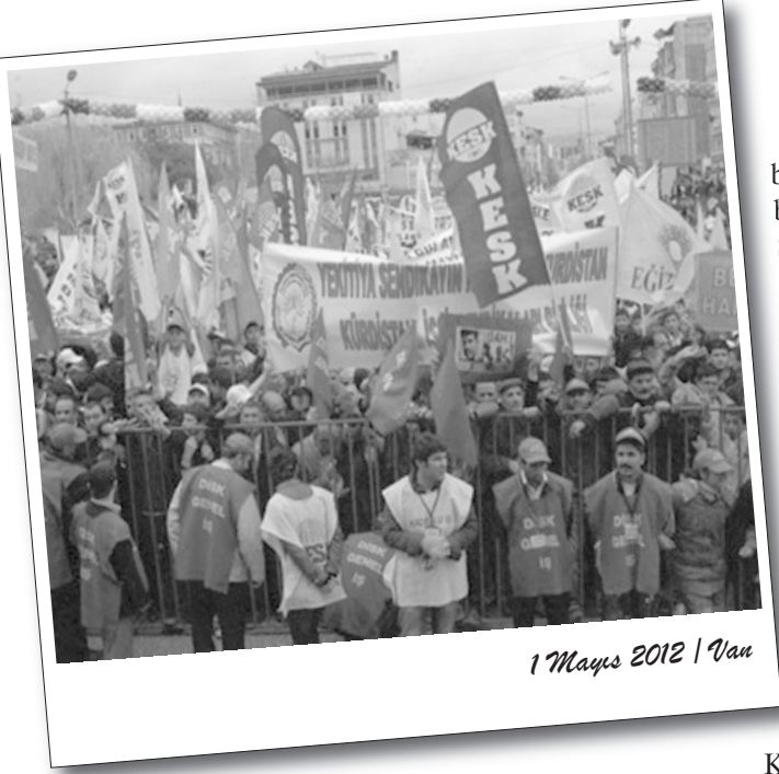
1 Mayıs 2012 / Van

Kürdistan'da 1 Mayıs eylemleri kitlesel ve coşkulu bir atmosferde gerçekleşti. Başta Diyarbakır olmak üzere Dersim'den Elazığ'a, Van'dan Şırnak'a kadar bir dizi Kürt ilinde 1 Mayıs kutlamaları gerçekleştirildi. Kürt halkı Newroz coşkusuyla 1 Mayıs alanlarına çıktı.