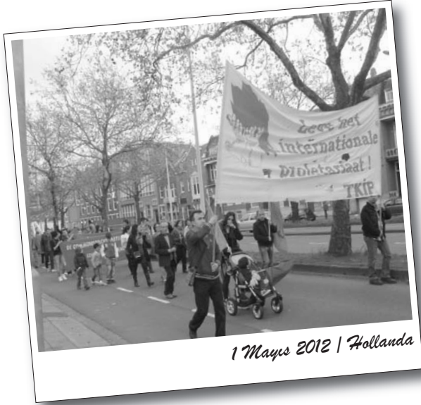
1 Mayıs 2012 | Hollanda