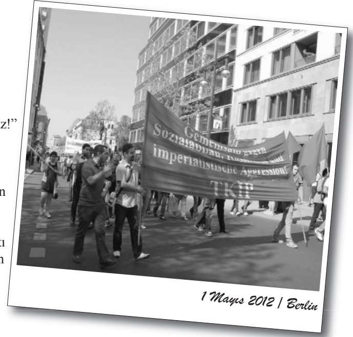
1 Mayıs 2012 | Berlin

1 Mayıs'ın içeriğini boşaltmaya dönük olarak yapılan bu festival tam anlamıyla bir karnaval havasında geçti. Yüzlerce yiyecek ve içecek standının yanısıra dans