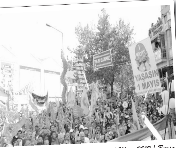
31 Mart 2012 | Bursa

Bursa'da bu yıl iki 1 Mayıs kutlaması gerçekleştirildi. Her iki 1 Mayıs gösterisi de Kent Meydanı'nda yapıldı. İlkini Türk-İş ve Türk Kamu-Sen, ikincisini ise KESK, TMMOB, TTB'nin Bursa şubeleri organize etti. Toplamda onbinlerce işçi, emekçi ve gencin katıldığı 1 Mayıs gösterileri, farklı iki ayrı politik atmosferde gerçekleşti. Sendikal bürokrasinin boy gösterdiği ilkine şovenist, ikincisine ise devrimci politik bir atmosfer hakimdi.