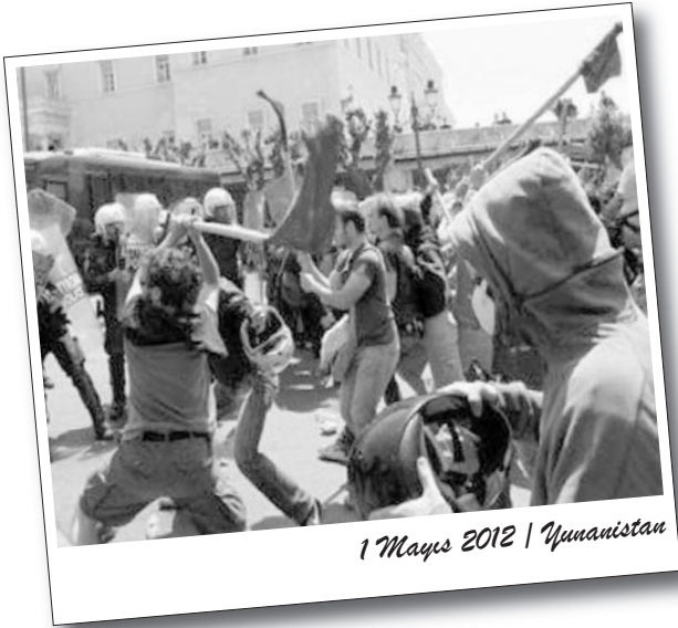
1 Mayıs 2012 | Yunanistan

Almanya'da Alman Sendikalar Birliği DGB'nin yaptığı açıklamaya göre gerçekleşen 420 yürüyüş, gösteri ve mitinge ülke çapında toplam 420 bin kişi katıldı.